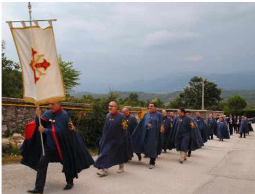
festività della Esaltazione della Santa Croce

Il 6 settembre i Cavalieri e le Dame, insieme alle loro famiglie intervenute, si sono recati in processione nel Santuario Mariano di Castelpetroso (IS) iniziando la novena in preparazione della festività della Esaltazione della Santa Croce. Nel Santuario si sono tenuti i Vespri e la celebrazione della Santa Messa.