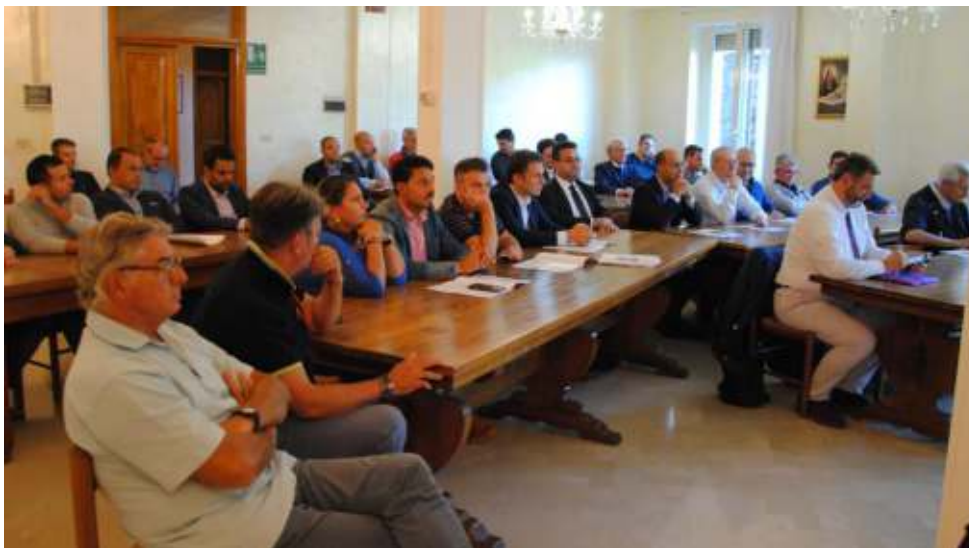
momenti dei lavori

I nostri assistenti spirituali hanno dato un grande risalto ai valori cristiani dell'Esortazione Apostolica sottolineando che essa comincia con la "Chiamata alla Santità", trattata nel primo capitolo, in cui papa Francesco ha spiegato chi sono i «santi della porta accanto» e quale missione ognuno di noi può avere, mentre nel secondo capitolo si descrivono i «due sottili nemici» della santità: lo gnosticismo e il pelagianesimo. Nel terzo capitolo, "Alla luce del Maestro", arriva la risposta alla domanda su come essere, davvero, un buon cristiano, mentre nel quarto capitolo si