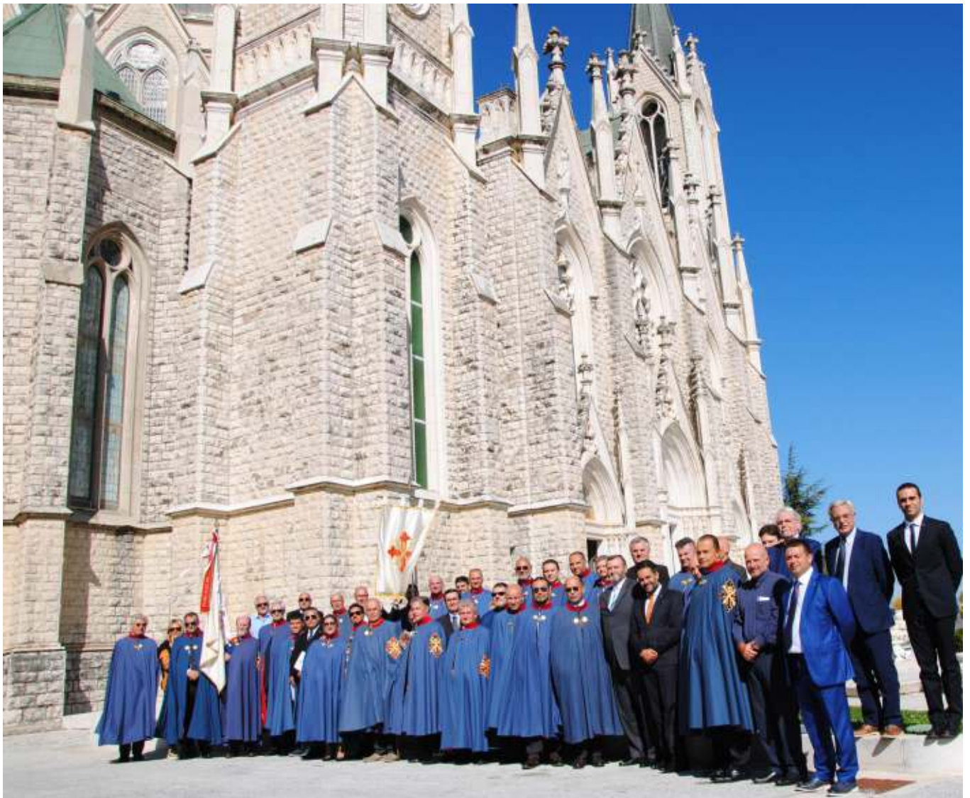
foto di gruppo dei partecipanti al Ritiro Spirituale 2017