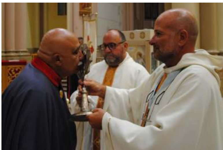
Bacio della reliquia del Legno della Santa Croce

Nell'Omelia i nostri celebranti hanno tenuto una toccante riflessione sull'importanza della Festa nel mondo Cristiano e sul significato della stessa per la Milizia Costantiniana, ricordando le indulgenze concesse all'Ordine dal Santo Padre Francesco per i partecipanti.