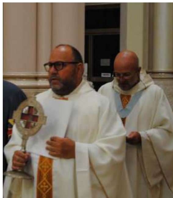
reliquia del Legno della Santa Croce

La liturgia è terminata con la benedizione impartita con la