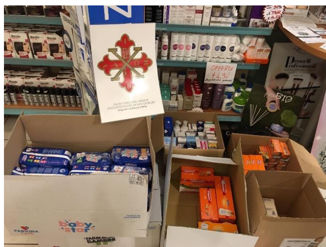
Raccolta di medicinali per i bambini in “povertà sanitaria”

Con l'aiuto di alcuni nostri Cavalieri e Dame si sta provvedendo all'acquisto di ingenti quantità di derrate alimentari che saranno distribuite sia direttamente dai nostri volontari a famiglie indigenti del territorio di competenza sia, in parte, in collaborazione con la Caritas delle Diocesi.