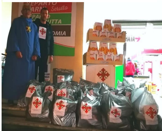
pacchi dono consegnati alla Caritas per le famiglie

La Delegazione di Abruzzo e Molise per il mese di novembre e dicembre 2021 ha posto in essere una serie di iniziative a favore delle persone meno abbienti in osservanza del progetto umanitario fortemente voluto dal nostro amato Gran Maestro che è "la fame del nostro vicino" .