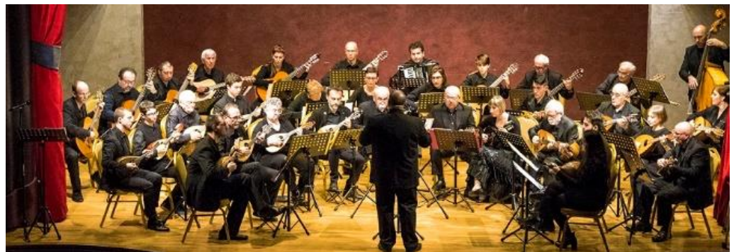
Ensemble Mandolinistico del “Circolo Musicale P.Mascagni”

Il programma proposto da questo Ensemble Mandolinistico del “Circolo Musicale P.Mascagni”, ha spaziato nel più puro barocco nelle proprie declinazioni “nazionali”