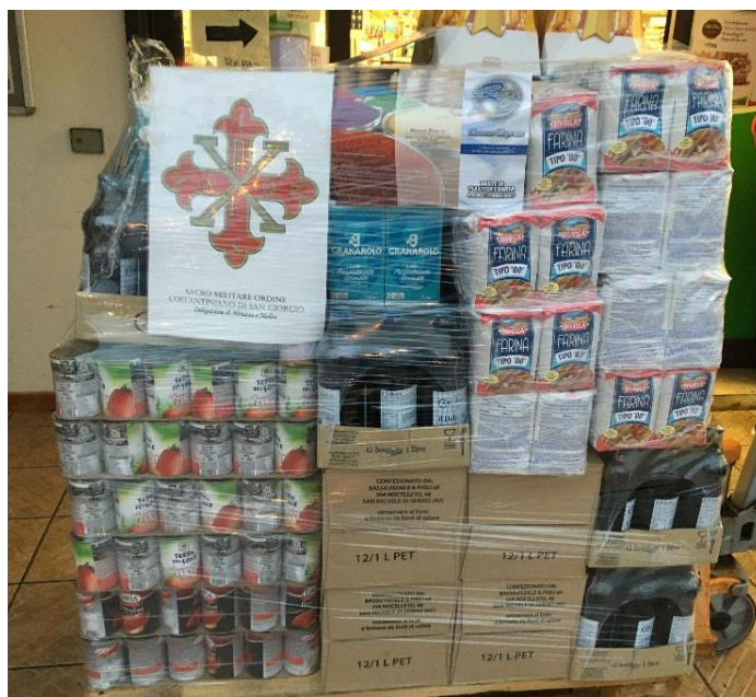
Parte delle derrate alimentari acquistate