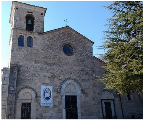
Facciata della Concattedrale

La Concattedrale dedicata a Santa Maria Assunta rappresenta il massimo tempio della città di Venafro ed è anche una tra le chiese più grandi della regione. La chiesa fu costruita alla fine del V secolo, sotto il vescovo Costantino, lì dove sorgeva un precedente tempio pagano utilizzando materiali di spoglio provenienti da altri siti di epoche precedenti,