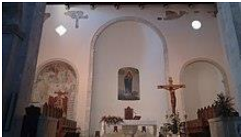
presbiterio della Concattedrale

infatti si rinvenivano resti del periodo romano e decorazioni cristiane, come il bassorilievo del vescovo Pietro di Ravenna: un rilievo che, per il suo aspetto inconsueto, viene chiamato dagli abitanti Marzo Settecappotti . L'antico edificio di culto subì