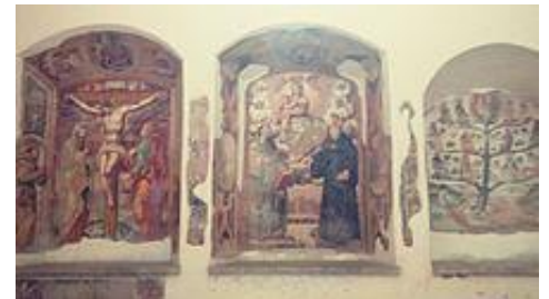
Affreschi nella Concattedrale

su ordine dell'imperatore Ludovico e dovette dare ospitalità alle truppe di Carlo VIII. Inel 1495. Questo obbligò a continue modifiche, aggiustamenti e ricostruzioni. Sul finire del 1600 fu costruito il cosiddetto cappellone , una cappella destinata all'amministrazione dei Sacramenti, rimaneggiato poi nel corso dell'Ottocento. Tra la fine del Seicento e per tutto il Settecento la chiesa fu abbellita in stile barocco: a seguito di queste aggiunte sostanziali, la chiesa fu riconsacrata il 21