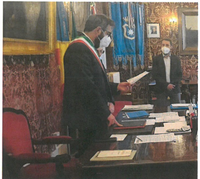
Il conferimento della cittadinanza