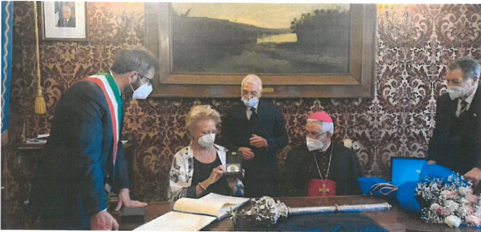
Un momento della cerimonia presso la Sala Rossa