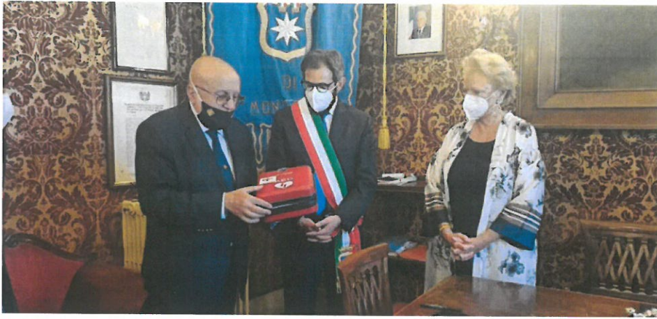
La consegna del defibrillatore